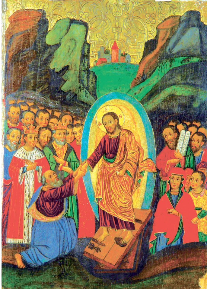
«ВОСКРЕСІННЯ – ЗІШЕСТЯ ДО АДУ» Походить із каплиці Покладення риз Пресвятої Богородиці с. Прохід Ратнівського деканату. Матеріали: дерево, левкас, темпера, золочення. Реставрація 1991 р. (підприємство «Скіфія», м. Київ). Експонується у Музеї волинської ікони

Окрім Адама і Єви, у цій композиції обов'язково зображаються старозавітні царі Давид та Соломон. Юний Соломон – у червоному царському наряді, прикрашеному горностаєвим хутром. Поруч – немолодий, сивочолий, із сивою широкою бородою Давид. Він є прабатьком Христа за плоттю, адже